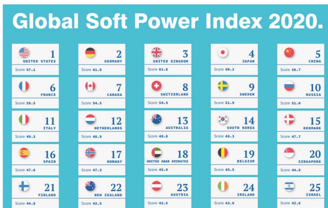
Рис. 3 – Глобальный индекс мягкой силы 2020

Согласно шестиугольнику Саймона Анхольта, одной из наиболее развитых сфер Германии является сфера культуры, истории и образования, и как можно увидеть не зря. Необходимой составляющей формирования позитивного бренда Германии уже давно считается работа фондов в контексте популяризации культурного просвещения, наиболее известные примеры: DAAD Германская служба академических обменов и Гете институт [5].