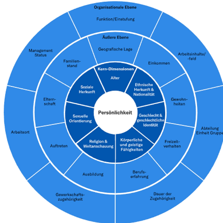
Рис. 2. Многослойная модель общественной жизни «Хартия многообразия» (по: [25])

(возрастные, гендерные, этнические, образовательные уровни, семейные признаки) на предприятиях и в учреждениях Германии является «Хартия многообразия» (Рис. 2).