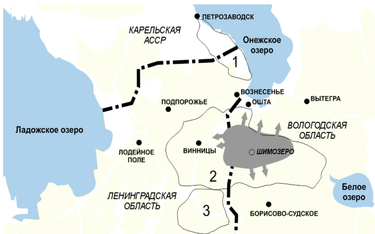
Рис. 1. Схема миграции вепсского населения бывш. Шимозерской волости в 1950-60-е гг. Схематично обозначены территории расселения: 1 – северных (прионежских) вепсов; 2 – средних (оятских) вепсов; 3 – южных вепсов.

Ликвидация п. Шимозеро и окружающих деревень не только привела к массовой миграции этнических вепсов, ускорившей их ассимиляцию с русским населением, но и усугубила территориальную разобщенность этноса, в особенности – средних (оятских) вепсов. В то же время несколько отличная ситуация наблюдалась в Пяжозерском сельсовете Борисово-Судского (затем Бабаевского) района, где вследствие протестов местного населения удалось сохранить этнические деревни.