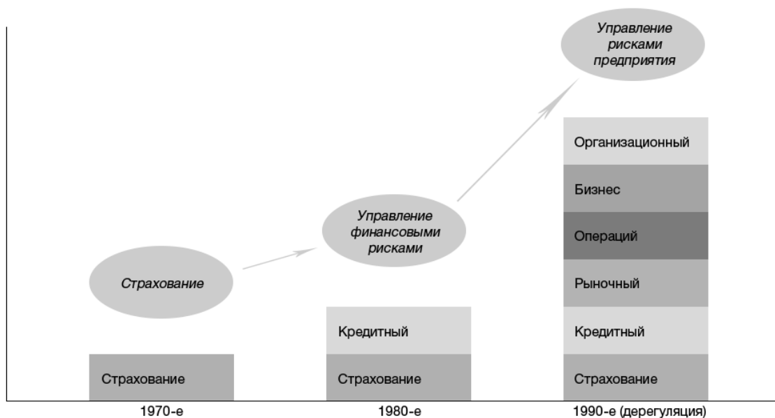
Рис. 1. Развитие подходов к управлению рисками (по материалам GARP).

Необходимо отметить, какие мировые события оказывали влияние на переломы в тенденциях отношения менеджеров и ученых к управлению рисками. Первый из них был связан с нефтяным кризисом 1970-х годов. До него страховые компании не прибегали, в частности, к сценарному анализу, появившемуся в течение холодной войны. В 1980-х годах, после изобретения и повсеместного распространения производных финансовых инструментов, произошел новый шаг в развитии научного подхода к управлению финансовыми рисками. Следующий всплеск научного интереса и внимания практиков к результатам исследований был зафиксирован в 90-е годы XX века. Этот виток развития был связан с шагом вперед в области компьютерных технологий, позволяющий любому пользователю проводить быстрые вычисления и оперировать большими объемами данных, что позволило совершить громадный скачок в банковской индустрии, и, в свою очередь, привело к появлению многочисленных новых источников подверженности банков операционному риску.