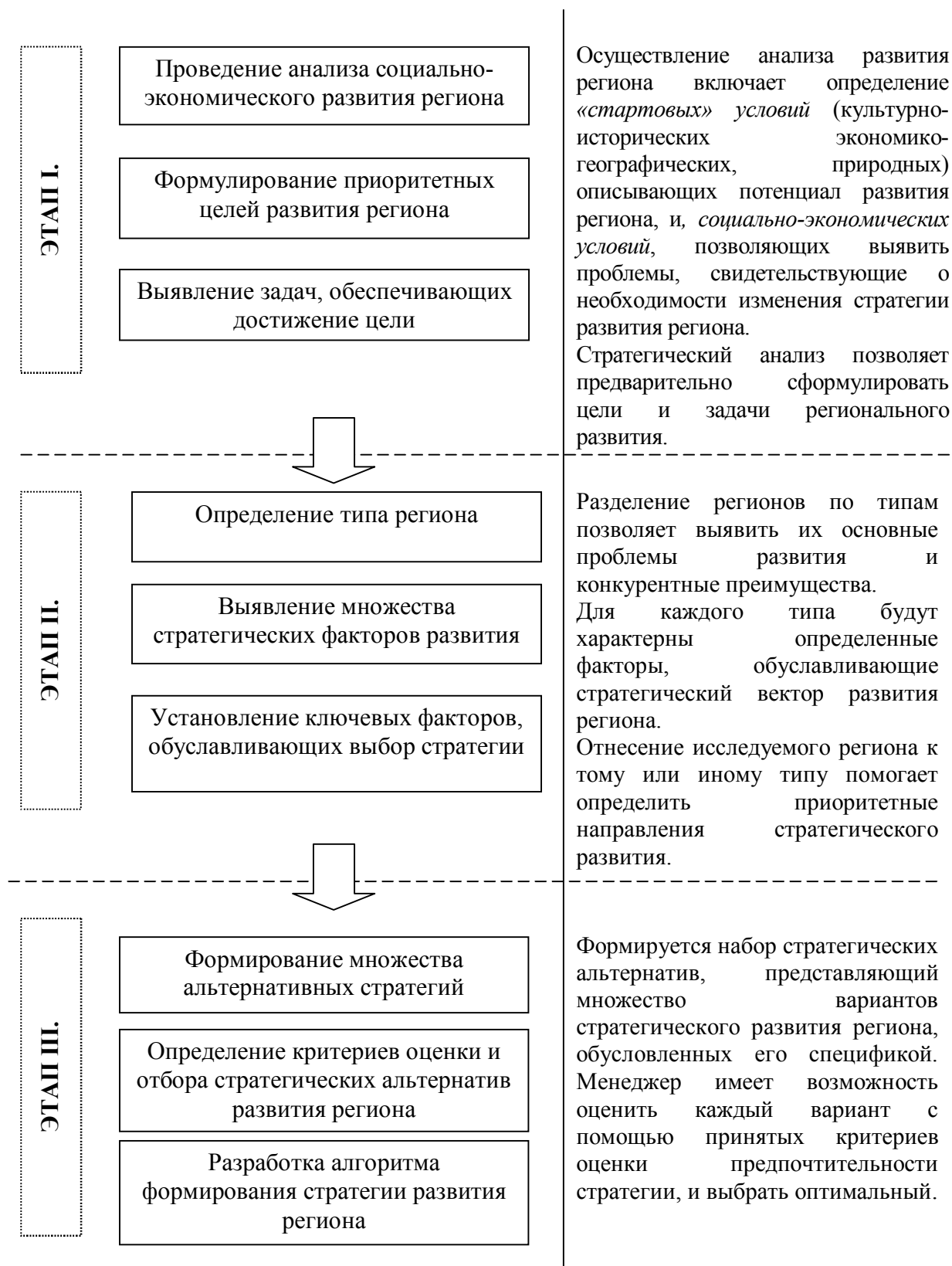
Рис. 1. Основные этапы формирования стратегии развития регионов