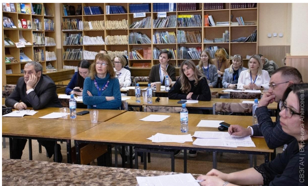
Рис. 2 Секция «Историко-культурное наследие Арктики, Сибири и Дальнего Востока»: участники.

Особенно заинтересовало присутствующих сообщение О.Н. Запороцкого (РОО «Тхсаном», г. Петропавловск-Камчатский) об обрядовом празднике ительменов «Алхалалалай», традиции которого уходят в глубокую древность (рис. 3).