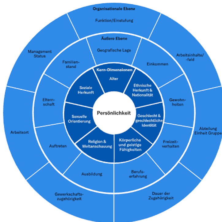
Рис. 2. Многослойная модель общественной жизни «Хартия многообразия» (по: [25])

(возрастные, гендерные, этнические, образовательные уровни, семейные признаки) на предприятиях и в учреждениях Германии является «Хартия многообразия» (Рис. 2).