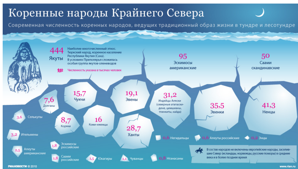
Рис.2 – Современная численность КНС

Анализируя традиционный уклад малых народов, и их интересную и самобытную культуру, хочется разделить мнение Льва Гумилева о том, что эта культура, с точки зрения этногенеза, относится к реликтовым.